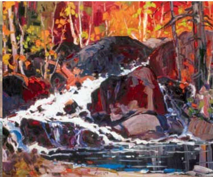
BRUNO CÔTÉ, LA DERNIÈRE FOSSE

pour la mouche noyée imposée à ailes en plumes parce qu'elle nous fait penser aux belles et enlevantes énergies de la nature, en particulier les aurores boréales, les arc-en-ciel, les nuits étoilées.