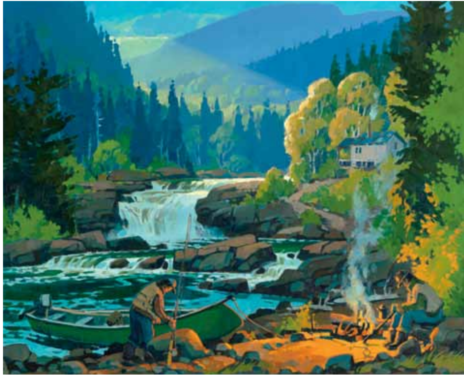
ST-GILLES, FIN DU JOUR, RIVIÈRE SAINTE-MARGUERITE

Depuis maintenant de nombreuses années, la Fédération québécoise pour le saumon atlantique parraine un Championnat international de montage de mouches à saumon. Au fil des ans, le championnat est devenu un des plus prestigieux avec la participation de plusieurs centaines de participants provenant du monde entier. Certains d'entre eux, par le défi ainsi proposé, se sont élevés au rang de maîtres-monteurs par les résultats d'excellence accumulés au cours des ans. Des chef-d'œuvres furent ainsi créés.