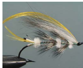
Nepisiguit Fall François Juliano Québec (Québec), Canada