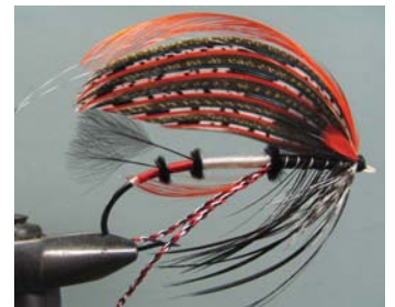
Disturbed Flow Ari-Heikki Rintaniemi Espoo, Finlande