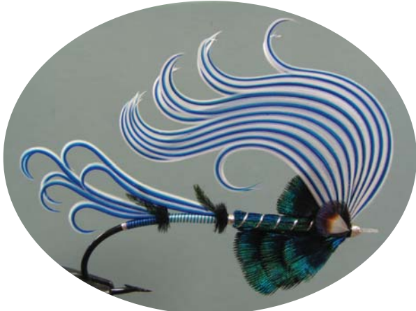
Foam-crested Wave Tero Lannes, Jokela, Finlande