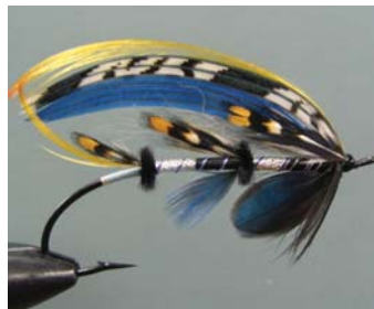
The Dark Storm Joni Haapanen Tampere, Finlande