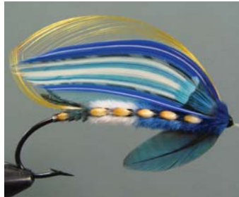
The Foaming Wave Jari Degerström Kotka, Finlande